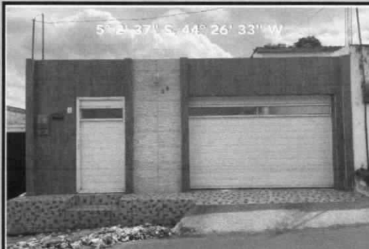
FOTO 02 - FACHADA FRONTAL