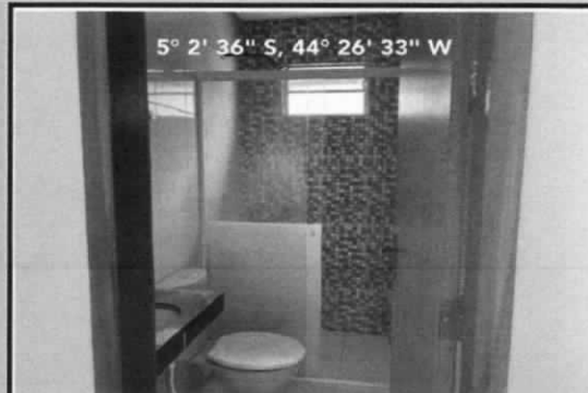
FOTO 08 - WC SUÍTE 02