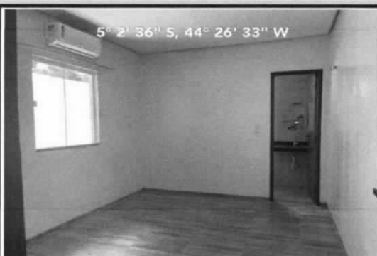
FOTO 09 - SUÍTE 03