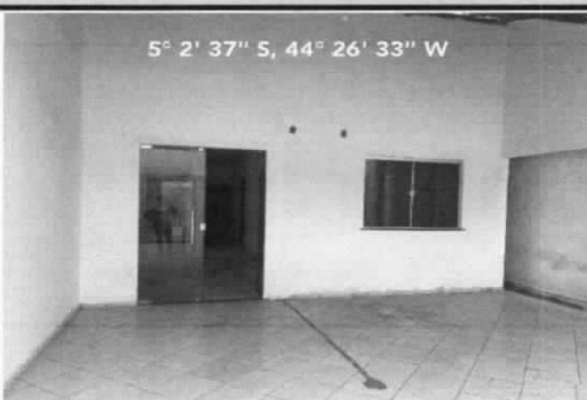
FOTO 03 - VARANDA COM VAGA PARA GARAGEM