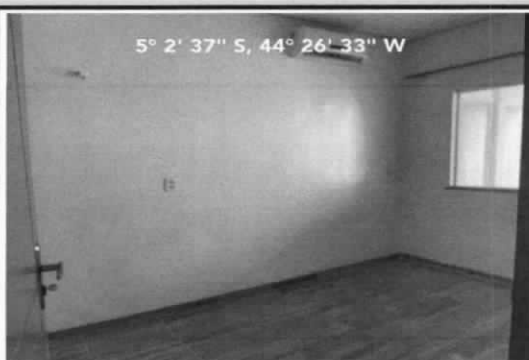
FOTO 05 - SUÍTE 01