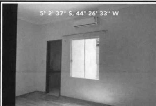
FOTO 07 - SUÍTE 02

ASSUNTO: RELATÓRIO FOTOGRÁFICO IMÓVEL RESIDENCIAL - NASF DATA: 06/05/2022