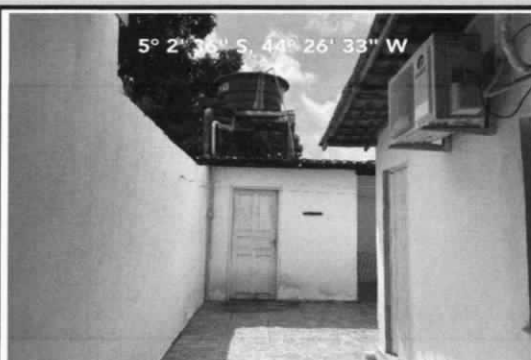
FOTO 11 - ÁREA EXTERNA CAIXA D'ÁGUA ELEVADA Fortlev 500 L