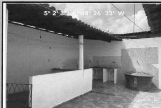
FOTO 12 - ÁREA DE LAVANDERIA