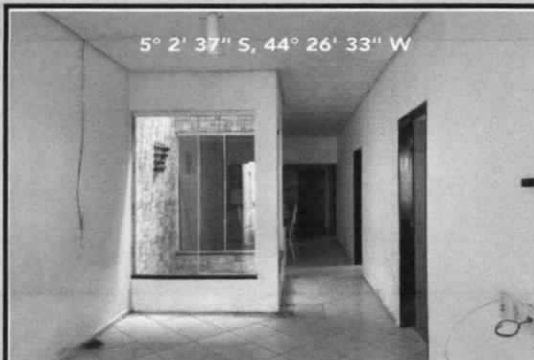
FOTO 04 - SALA DE ESTAR/JANTAR COM JARDIM DE INVERNO