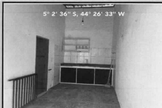
FOTO 10 - ÁREA DE SERVIÇO EXTERNA